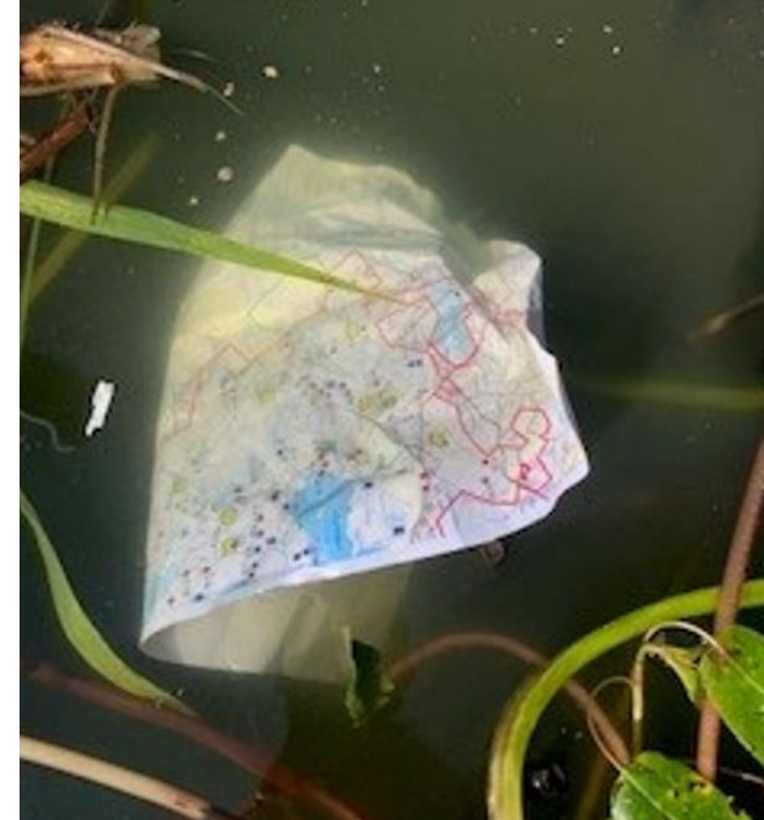
Säänkestävä kartta kestää vaikka tippuisi veteen