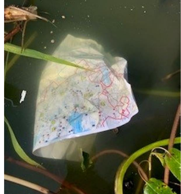
En väderbeständig karta håller, även om den skulle råka hamna i vatten.